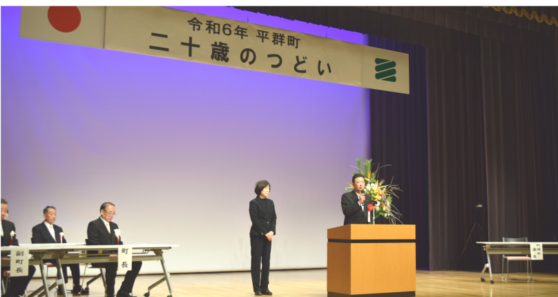
平群町「二十歳のつどい」で あいさつ 11月8日

その他、これまで私が一般質問で取り上げてきた協和橋東側交差点の改良に伴う168号の南側横断歩道の北への移設に伴い協和橋からの青信号を現在の10秒間以上に長くして頂く必要がある事も要望しました。