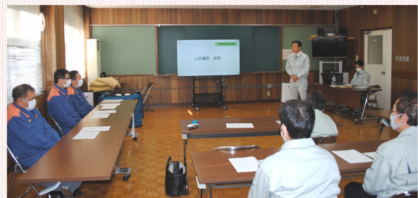
西和消防署の協力を得て開催した平群町議会の救命講習=2023年11月20日

平群町議会に於いても2年前に実施した救命講習(心肺蘇生法・AED使用訓練)の繰返し実施や『大規模災害』発生