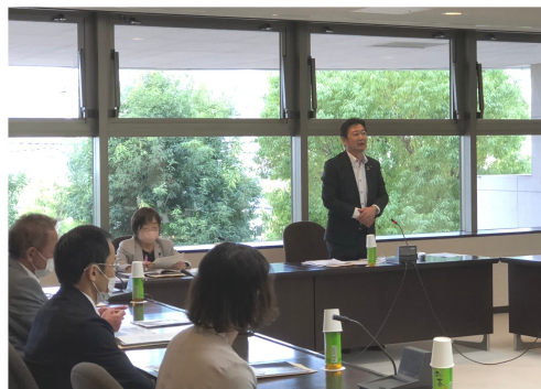
加西市への視察研修での挨拶

平群町議会に於いても『より身近で開かれた議会』をこれからも目指していかなければならないと決意を新たに致しました。