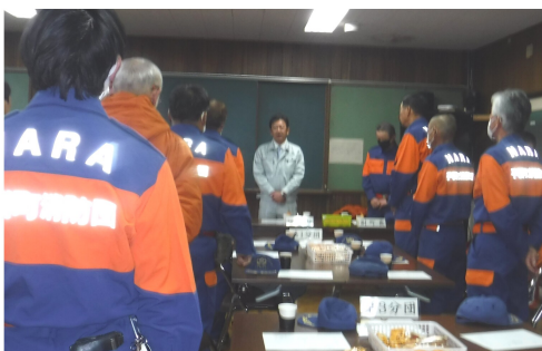
年末警戒の消防団を 激励 12月29日