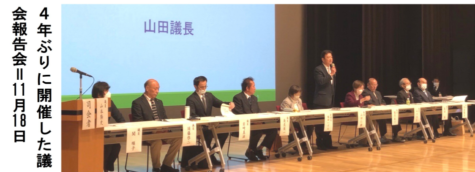
4年ぶりに開催した議 会報告会 11月18日