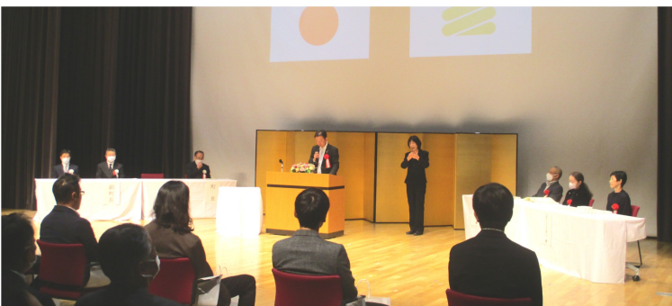
平群町自治功労者表彰 式 11月3日

令和5年12月1日、三郷町三室にある県立西和医療センターの老朽化に伴う移転先がJR法隆寺駅の南側で斑鳩ホール北側の位置に新設・移転されることが奈良県より発表されたと町長より報告を頂きました。 色々細かなところは決定されていませんが、地域医療を担う新病院は快適な環境整備は勿論、産科医療他機能充実に対する次の3項目について『新病院整備計画』に反映されることを要望する意見書が西和7町それぞれの12月議会にて決議されました。 ① 分娩を含む周産期医療体制の一体的整備 ② 小児二次救急体制の充実 ③ 医療・介護のオンラインによる情報連携をはじめとした地域包括ケアシステムの整備 西和7町議会で決議された意見書及び西和7町長の要望書を取りまとめ、令和5年12月25日、代表者により奈良県知事に提出されました。その他、JR法隆寺駅からの徒歩を含めた通院アクセス、経路やその他の公共交通による病院へのアクセスについても今後の検討課題であると思われれます。